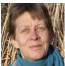
Regine Wölk Gestaltung & Layout