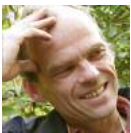
Thomas Hülsen Spielidee & Illustration